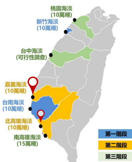
圖三、台灣本島海淡廠規劃