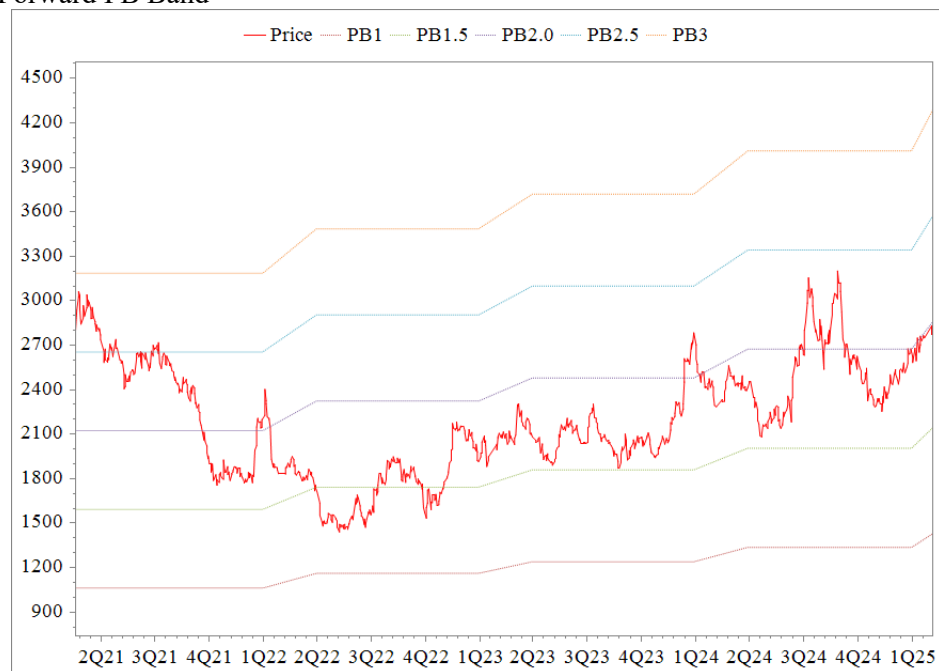
Forward PB Band