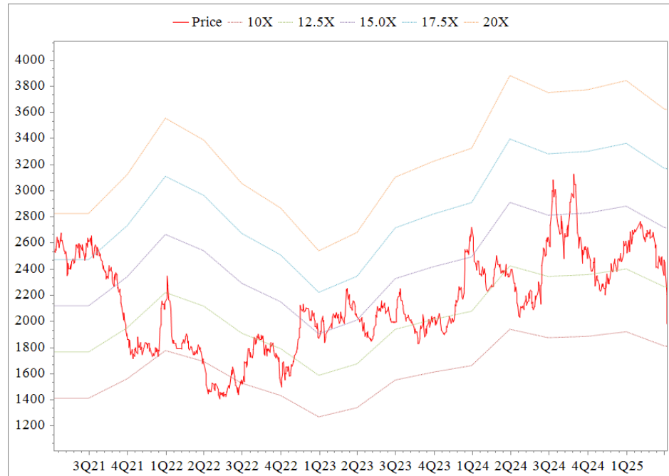
Forward PE Band