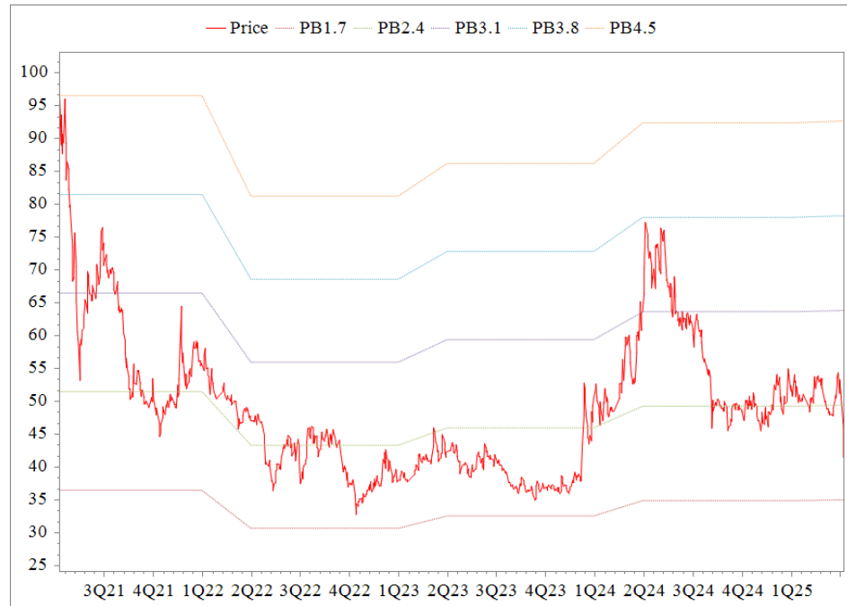
Forward PB Band