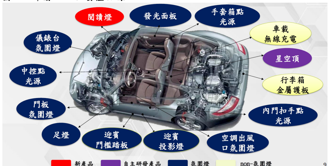
圖一、華勝-KY 主要產品線

華勝-KY(2248 TT)成立於 2003 年，由原始股東於中國成立宜蘭汽車配件公司(宜蘭汽配)，並於 2017 年在開曼群島設立控股公司。公司專注於汽車 LED 氛圍燈及智慧型車用電子零組件的研發、生產與銷售，為汽車供應鏈中 Tier1 供應商。公司主要產品包括汽車 LED 氛圍燈、汽車內外飾件、其他產品，分別佔 1Q24~3Q24 營收比重 81.4%、17.43%、1.18%。核心技術涵蓋智能照明系統、星空頂、電子天幕及智慧型閱讀燈模組等，華勝已取得多項專利與技術認證，並與全球主要車廠建立穩固合作關係。華勝-KY主要生產據點分布於中國與泰國，目前中國廠(宜蘭汽配)占總產能 95%；泰國廠佔總產能 5%。泰國廠主要因應美國關稅以及拓展東南亞新興市場，公司將擴增泰國產能，預計 2025 年完成土地購買及開始建廠，2026 年建廠完畢並進入量產。