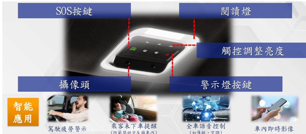
圖四、智慧型閱讀燈模組