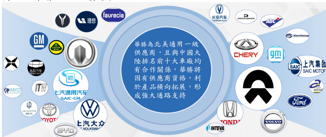
圖二、華勝-KY 主要客戶