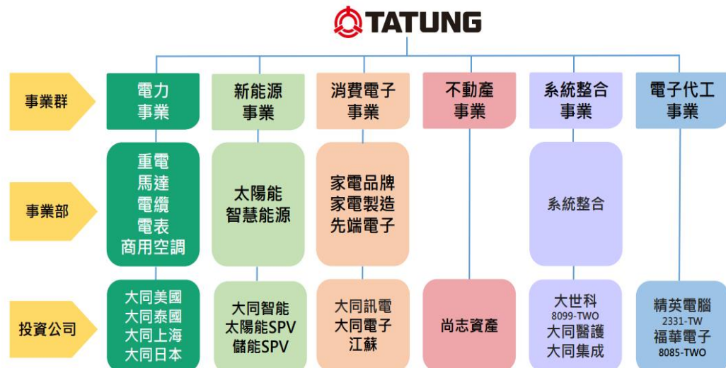
圖一、大同事業部門

大同成立於 1918 年，為全球綜合性大廠，目前旗下主要分為 10 大事業體，包括但不限於重電、智慧電表、智慧能源、電纜、家電製造等事業群，近年透過產品轉型，逐步成為台灣智慧節能管理與再生能源系統的領導廠商，過往曾用自有技術建置台灣第一套工業用高壓智慧電網高壓與民生用低壓智慧電表基礎建設，已然成為台灣智慧電網、微電網與智慧電表的領導先鋒。台灣基礎建設中所採用的智慧電表，不論是工業用或家用，多數皆由大同公司開發設計與製造完成。1Q-3Q24 產品占比，電力 26%、新能源 9%、消費電子 10%、不動產 3%、系統整合 14%、電子代工 38%。