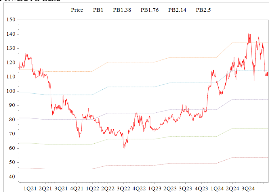
Forward PB Band