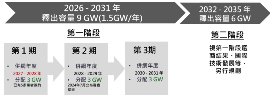
圖四：第三階段區域開發