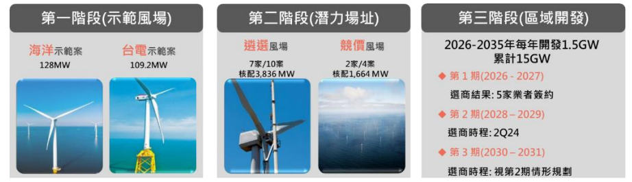
圖三：台灣風場開發政策