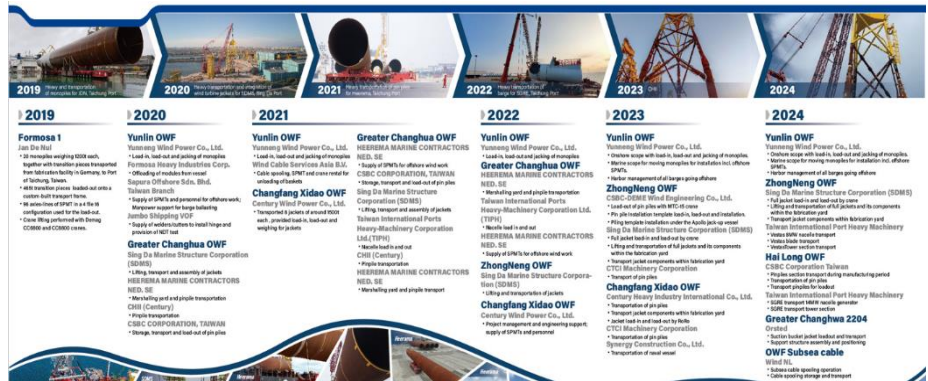
圖五：佳運風電運輸實績

重件運輸公司猛獁象(Mammoet)合作，透過與猛獁象互相交流，除了學習重件搬運相關經驗外，亦能向猛獁象租借重型設備，提升資產使用效率，公司曾向猛獁象承租全球最大的 4200 噸環式起重機，協助興達海基於興達港進行港內工作站搬運工作；佳運也於 2020 年與台灣港務公司合資成立港務重工(佳運持股 51%為權益法轉投資)，合作離岸風電的港埠搬運工作；目前佳運與猛獁象及港務重工仍維持密切合作關係，持續深耕布局台灣第三階段離岸風電專案。