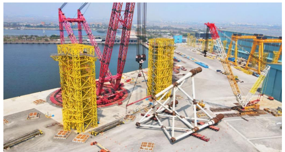
圖六：興達海基廠搬運示意圖

佳運於 2019 年開始切入離岸風電運輸，首先參與海洋示範案場，2020 年受到疫情影響，台灣風場建置進度下降，公司仍不遺餘力，陸續協助允能、大彰化風廠、彰芳西島等風廠建置。2022 年營運受惠於疫情後台灣風場恢復建置，佳運支援各風場開發商進行風力機組及水下基礎、基樁之運輸，包含(1) 彰芳西島-離岸風電水下基礎及基樁運輸，透過自走式模組化運輸車(Self-Propelled Modular Transporter, SPMT)，協助世紀風電將套管式水下基礎在各廠房之間運輸；(2) 天豐允能風場-離岸風電水下單樁基礎運輸裝卸；(3)中能風場-使用多軸式油壓模組板架以及曳引車，協助 Vestas 離岸風電風機葉片運輸。佳運 2022-2023 年受惠離岸風場建置工程營收成長 60%以上，使能源工程占比高達 80%左右，預計 2H25-2026 年開始進入第三階段風場建置潮，可望重啟高速成長動能。