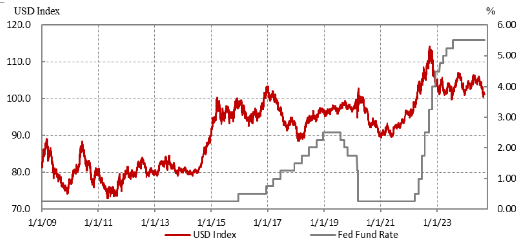
圖 1：美元指數與聯準會基準利率