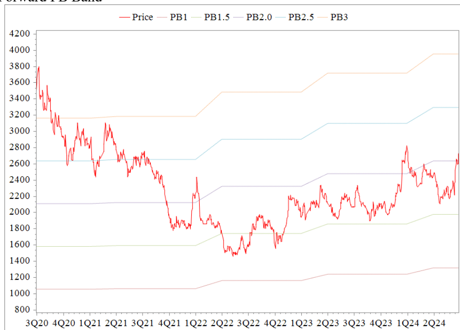
Forward PB Band