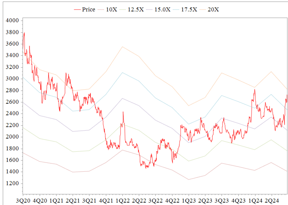
Forward PE Band