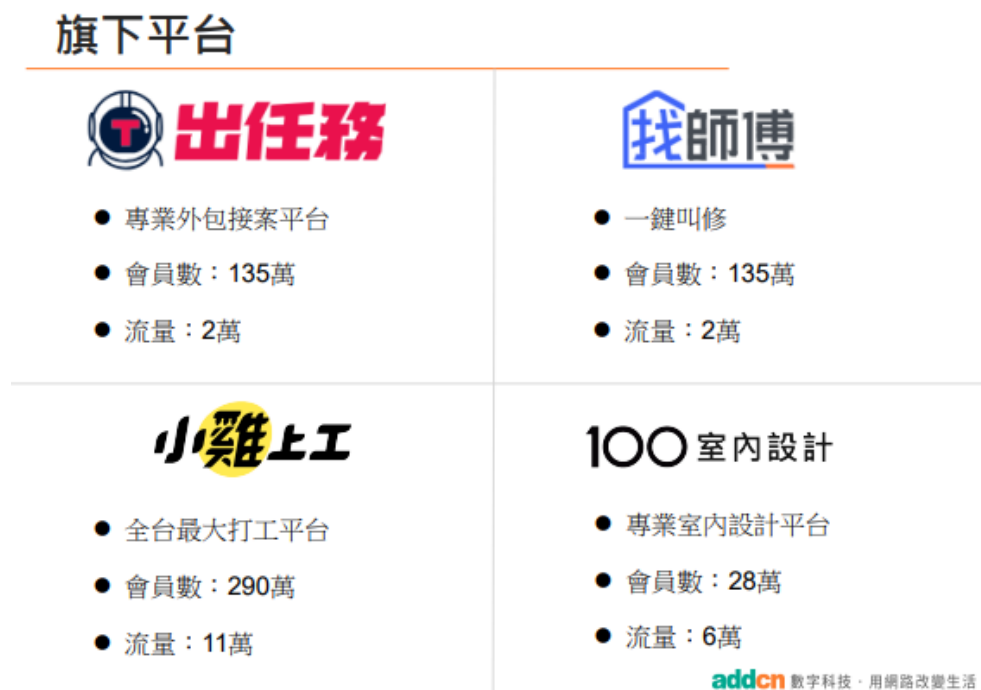
圖二、數字科技旗下新創平台

軟體工程師、翻譯和美編相關，而「找師傅」則以居家修繕和清潔的外包接案為主；2.「小雞上工」：全台最大的打工 APP，專為媒合大學生與雇主找兼職工讀所設計；3.「100 室內設計」：主要係媒合裝潢設計者與消費者，提供高品質的設計作品供消費者參考。因新創平台營收占比不高，故目前將「出任務」、「找師傅」和「小雞上工」的營收歸在 518 熊班，而「100 室內設計」的營收則歸在 591 房屋交易網。