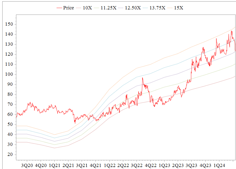
Forward PE Band