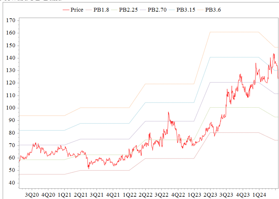
Forward PB Band