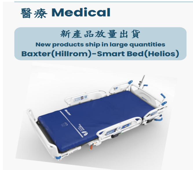
圖一、八貫新型 ICU 病床-Smart Bed

4Q23受惠醫療、減重版逃生滑梯逐步出貨，4Q23營收6.56億元，QoQ-1.07%，稅後純益1.31億元，QoQ-15.02%，EPS 1.83元。