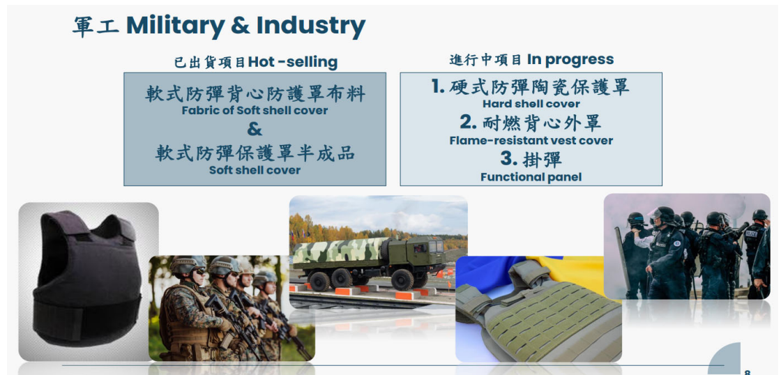
圖二、八貫軍工產品內容

1Q24受惠軍工產品完成認證，加上新式防彈背心可減重20%，有效因應現代戰場需求，預期產品逐步放量出貨，成為2024年八貫成長幅度最大的產品，並且考量先前新產品持續貢獻營收，使得八貫1Q24產能迎來滿載，預估八貫1Q24營收6.56億元，稅後純益1.39億元，QoQ +6.33%，EPS 1.95元。