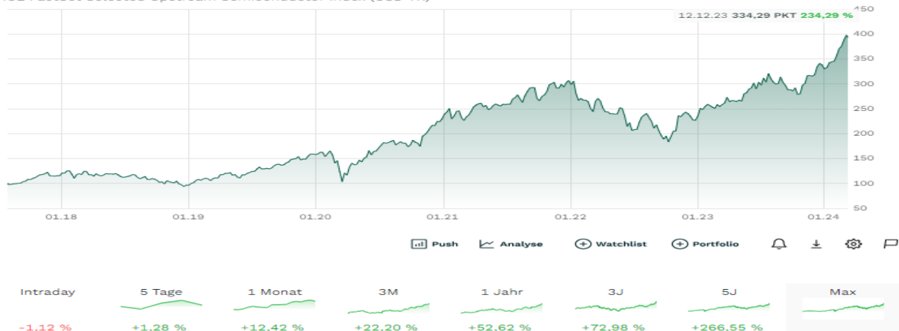
ICE FactSet Selected Upstream Semiconductor Index (USD TR)