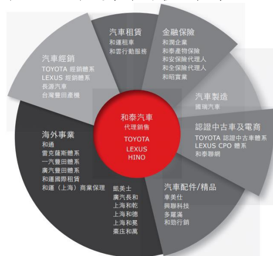
表一、和泰汽車集團營運範疇

和泰車為國內汽車市場龍頭，主要業務為代理國際汽車品牌銷售，目前代理的品牌包括 TOYOTA、LEXUS 及 HINO 商用車、台灣豐田物料運搬(鏟土機、推高機)等，並兼營汽車租賃、分期付款、汽車保險、汽車用品、中古車買賣等業務。以部門別來看，和泰車事業部門主要分為租賃業務、分期業務、代理銷售事業及其他事業等四個部分，以代理銷售佔營收比重最高。市占率方面，和泰車 2011 年~2016 年於國內新車銷售市場市佔率約落於 32%~34%。因受舊車款銷售週期影響，2017 年~2018 年市佔率下滑至 28%~29%，隨著新車款上市，2019 年~2020 年市佔率已回升至 32%，2021 年、2022 年市占率皆為 33%。2023 年市占率進一步拉升至 34.9%。