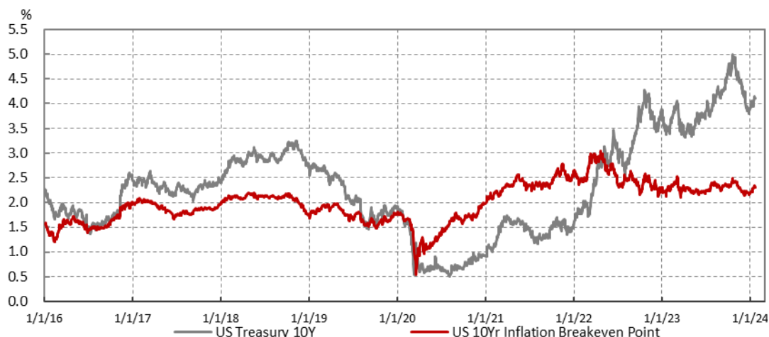
圖 1：美國十年期公債殖利率與抗通膨公債利差