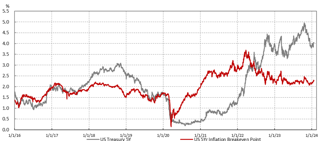
圖 2：美國五年期公債殖利率與抗通膨公債利差